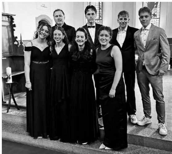
Am Sonntag, 26. April, und am Sonntag, 3. Mai, fanden bei wunderschönem Frühlingwetter die beiden Konfirmationen statt. Einmal acht und einmal sieben junge Frauen und Männer gestalteten einen wunderschönen Gottesdienst und feierten die Bestätigung ihrer Taufe.